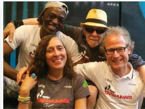
Jazz'ens for the Planet